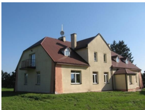
Zdjęcie 8. Dwór w Głazowie

1. Dwór i park w Głazowie – majątek do czasu reformy rolnej w 1944 roku stanowił własność znanej w regionie rodziny Strużyńskich. Obecnie, jako własność gminna mieści szkołę podstawową. Budynek został znacznie przebudowany, jednak dzięki swojej funkcji jest zadbane i odpowiednio zabezpieczony przed zniszczeniem. Z dawnego parku pozostało zaledwie kilkanaście drzew. Zespół dworsko-parkowy w Głazowie widnieje w rejestrze zabytków.