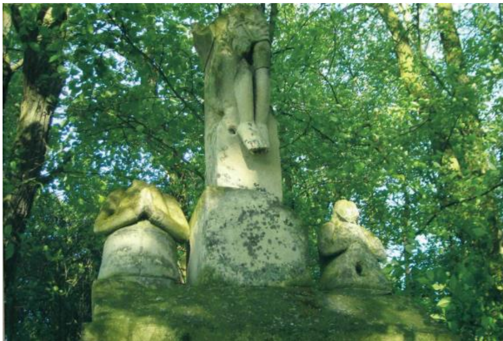
Zdjęcie 14. Krzyż kamienny choleryczny na postumencie w Bilczy

Wiele zabytków uległo zniszczeniu z powodu upływającego czasu, jednakże są też takie, które zostały zniszczone działaniami wojennymi, które przetoczyły się przez kraj zarówno podczas I jak i II wojny światowej. Jedną z takich pamiątek przeszłości, nie będąc wpisaną do rejestru zabytków jest krzyż kamienny w Bilczy. Figura ta powstała w 1873 roku jako pamiątka po zmarłych na cholere dwóch synach z rodziny Dąbrowskich. Krzyż ten znajduje się pomiędzy drogą powiatową Obrazów- Kleczanów, umiejscowiony na lewym brzegu rzeczki Czarnej, prawym dopływie Dębianki. Rzeźba przedstawiała sobą krzyż na postumencie, na nim ukrzyżowanego Chrystusa, którego górna część została doszczętnie zniszczona.