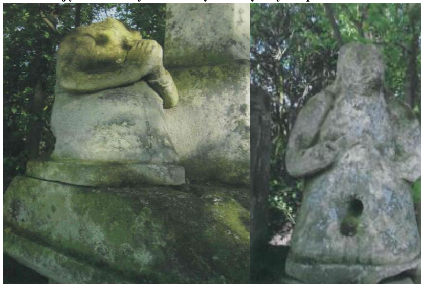
Zdjęcie 15. Krzyż kamienny choleryczny na postumencie w Bilczy