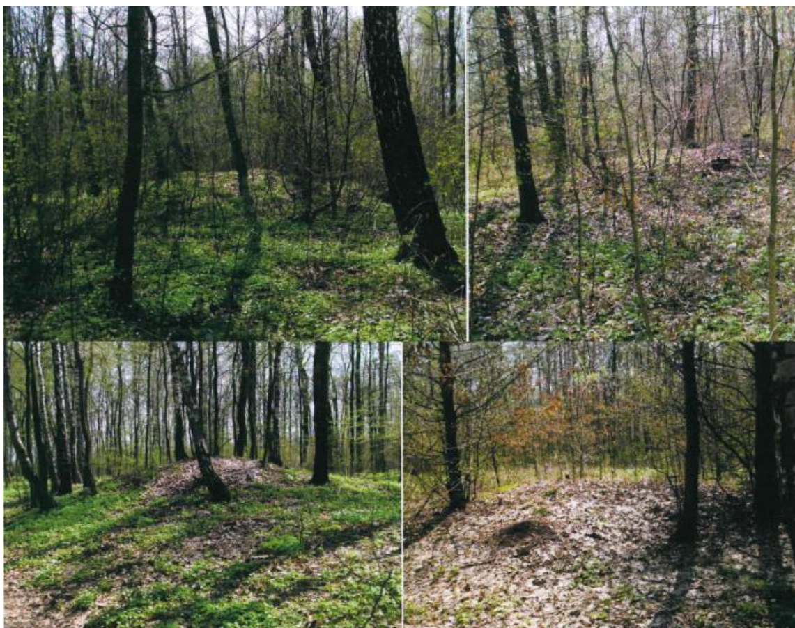
Zdjęcie 23. Cmentarzysko kurhanowe w Kleczanowie

Cmentarzysko kurhanowe w Kleczanowie zlokalizowane jest w lesie od zachodniej strony wsi na trasie Sandomierz- Opatów. Jego odkrywcą był Marek Florek w 1990 roku podczas badań „Archeologiczne Zdjęcie Polski”. Odkryto tam 37 kopców z różnych epok dziejowych. Najstarszy z nich jak ustalono był zbudowany przez ludność kultury ceramiki sznurowej, a jego powstanie datuje się na około 2800- 2300 rok