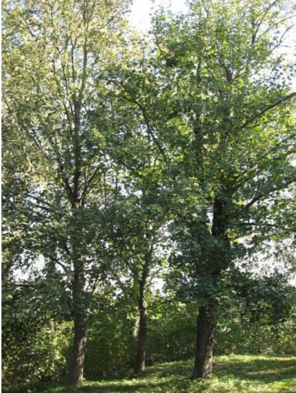
Zdjęcie 11. Park w Świąticy

3. Dawny dwór w Świąticy stanowi współwłasność prywatną i gminną. W stanie bardzo zaniedbanym jest zamieszkiwany przez kilka rodzin. Otoczenie budynku to resztki dawnego parku (w 1957 roku wpisany do rejestru zabytków), który z biegiem lat, wraz z rozbudową mieszczącego się na terenie majątku zakładem usług technicznych systematycznie wycinano. Dziś zachowały się jedynie pojedyncze drzewa. Zabytkiem jest także spichlerz, do którego dojść można mijając zaniedbane budynki dawnych zakładów. Posiada front w formie portyku – widnieje na nim data 1873. Z każdej strony otoczony jest bujnymi zaroślami. Obecnie nie jest użytkowany i popada w ruinę.