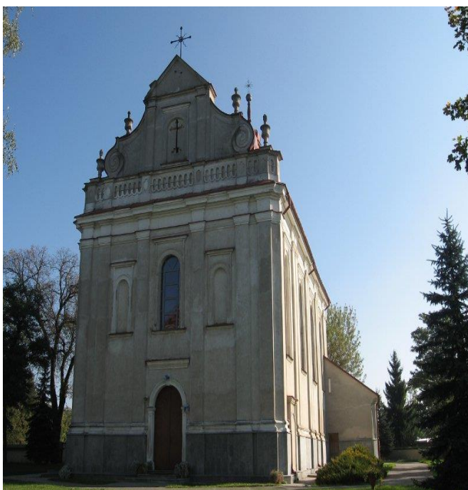
Zdjęcie 1. Kościół w Obrazowie