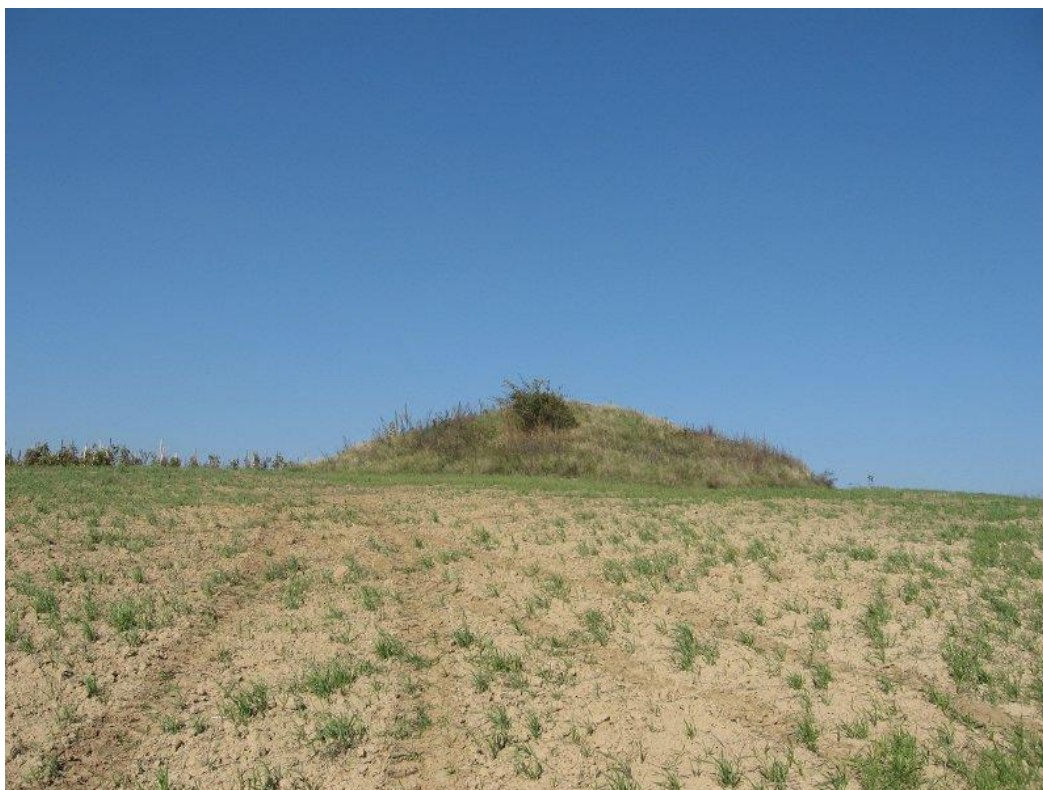
Zdjęcie 22. Kurhan w Świącicy

W dniu 29.09.2020r. przeprowadzona została kontrola w/w kurhanów w Świącicy przez inspektorów Wojewódzkiego Urzędu Ochrony Zabytków w Kielcach Delegatura w Sandomierzu. Jak wynika z protokołu oba kurhany są w stanie dobrym, oba nasypy wykoszone. Nie zarejestrowano żadnych zniszczeń.