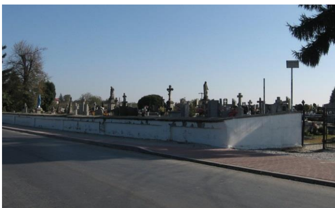
Zdjęcie 5. Cmentarz w Obrazowie

Dziedzictwo kulturowe Gminy Obrazów stanowią również cmentarze, głównie wyznaniowe. Wśród nich 2 zostały wpisane do rejestru zabytków: cmentarz parafialny w Obrazowie oraz cmentarz wojenny z I wojny światowej w Rożkach. Na cmentarzach tych zlokalizowane są mogiły o wartości historycznej, w tym ludności cywilnej z okresu II wojny światowej oraz cmentarz wojenny z czasów I wojny światowej na peryferii wsi Rożki. Opiekę nad nekropoliami przykościelnymi sprawują parafie. Ponieważ są one otwarte dla celów grzebalnych o poszczególne mogiły dbają także rodziny zmarłych. Obowiązek utrzymania cmentarza wojennego w Rożkach spoczywa na Gminie. Jest on zadbane, ogrodzony i odpowiednio oznaczony.