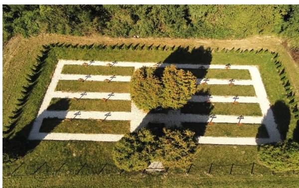
Zdjęcie 7. Cmentarz w Rożkach