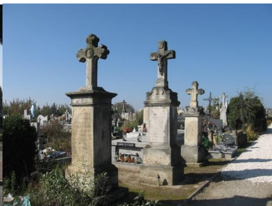
Zdjęcie 6. Cmentarz w Kleczanowie