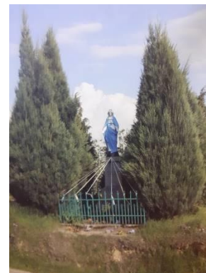
Zdjęcie 20. Figura Matki Boskiej w Świąticy- przed renowacją

Na frontowej części postumentu widnieje inskrypcja: