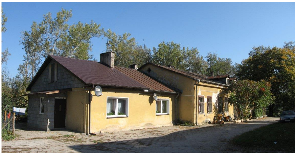
Zdjęcie 13. Dwór w Świąticy