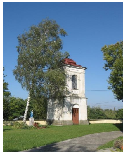
Zdjęcie 2. Dzwonnica przy kościele w Obrazowie

2. Drewniany kościół parafialny p. w. św. Katarzyny Dziewicy Męczennicy i św. Stanisława Biskupa Męczennika w Kleczanowie, został wzniesiony pod koniec XVII wieku w miejscu dwóch poprzednich zniszczonych świątyń. Mieści m. in. zabytkowe ołtarze, ambonę, chrzcielnicę. Posiada dokumenty parafialne od 1773 roku.