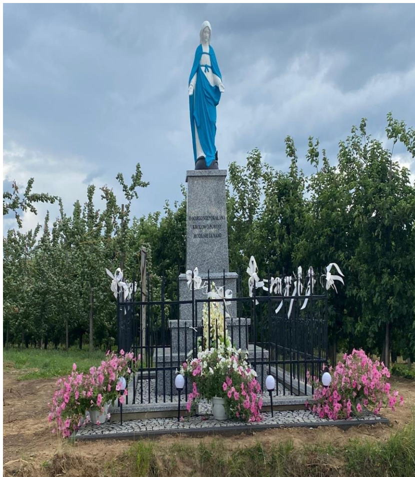
Zdjęcie 19. Figura Matki Boskiej w Świąticy

Spośród wielu figur przedstawiających Matkę Boską interesująco przedstawia się figura Matki Boskiej w Świąticy, która powstała w 1943 roku. Umiejscowiona jest przy drodze Świąticy- Komorna. Pierwotnie znajdowała się na skraju wąwozu, którego zasypano podczas budowy drogi asfaltowej. Figura została odnowiona, zastosowano piaskowanie i malowanie figury. Ponadto obłożono cokoły granitem, wyłożono kostkę granitową, odnowiono ogrodzenie i usunięto rosnące przy niej tuje.