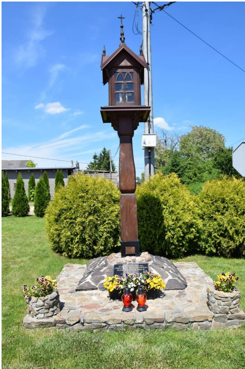
Zdjęcie 17. Kapliczka drewniana nasłupowa z rzeźbą Chrystusa Frasobliwego

Jednym z wielu śladów minionej epoki nie wpisanych do rejestru zabytków jest także nasłupowa kapliczka drewniana znajdująca się w miejscowości Dębiany. Przyozdobiona rzeźbą Chrystusa Frasobliwego powstała na początku XIX wieku w Dębianach Szlacheckich, części obecnych Dębian.