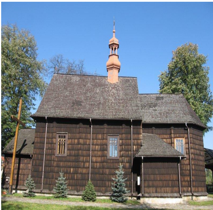
Zdjęcie 3. Kościół w Kleczanowie

Kościół, z racji ciągłego użytkowania i środków wystarczających na pokrycie bieżących wydatków, utrzymane są w dobrym stanie. Dzięki ofiarności parafian oraz dotacji przekazanej przez Urząd Marszałkowski Województwa Świętokrzyskiego możliwe stało się rozpoczęcie prac nad odtworzeniem pierwotnych malowideł