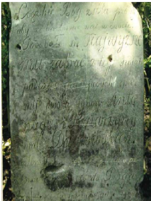
Zdjęcie 16. Krzyż kamienny choleryczny na postumencie w Bilczy