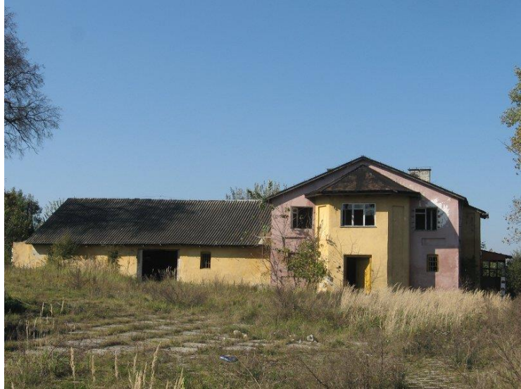
Zdjęcie 12. Spichlerz w Świąticy