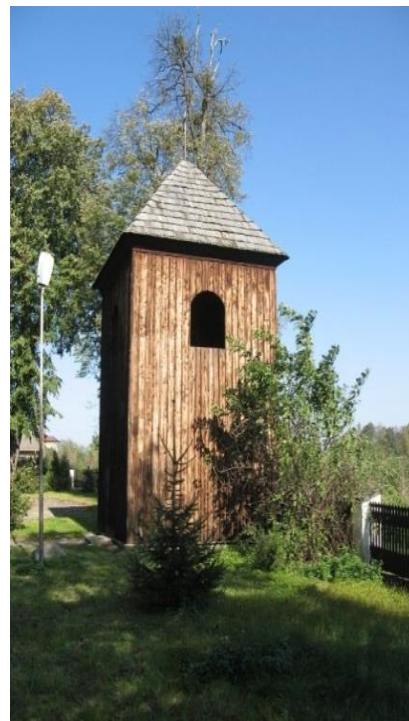
Zdjęcie 4. Dzwonnica przy kościele w Kleczanowie

we wnętrzu kościółka w Kleczanowie. Podobne prace, jednak tylko dzięki środkom zgromadzonym przez parafię trwają w kościele w Obrazowie. Zabytkowe zespoły kościelne, ponieważ wciąż spełniają swoje funkcje centrów życia religijnego miejscowej społeczności mają szansę przetrwać jeszcze długie lata w dobrym stanie. Dzięki pracom konserwatorskim zabytkowe kościoły zachowują swój oryginalny wygląd, a jako element krajobrazu kulturowego spełniają swą funkcję kształtowania indywidualnej i zbiorowej sfery pamięci.