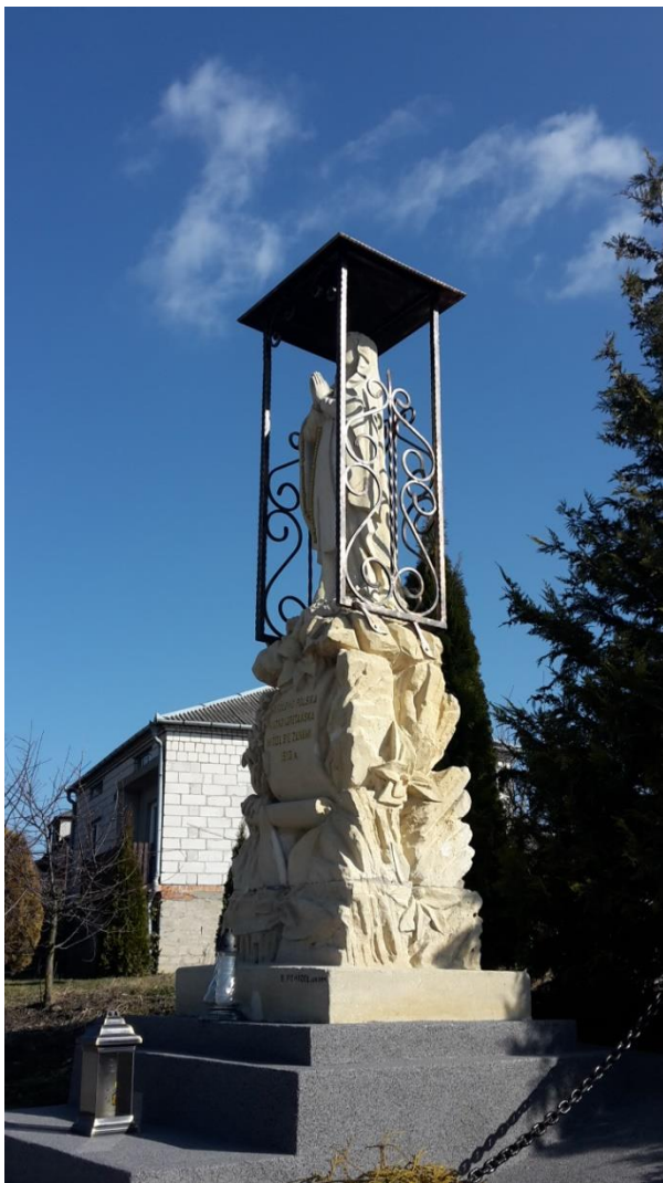
Zdjęcie 18. Figura Matki Boskiej z Lourdes w Głazowie

Innym zabytkiem zasługującym na zainteresowanie jest figura Matki Boskiej z Lourdes. Rzeźba powstała w 1910 roku naprzeciw drogi prowadzącej do dawnego dworu w Głazowie, w którym obecnie mieści się szkoła podstawowa. Postać Matki Boskiej stoi na wzniesieniu wyrzeźbionych skał i kwiatów.