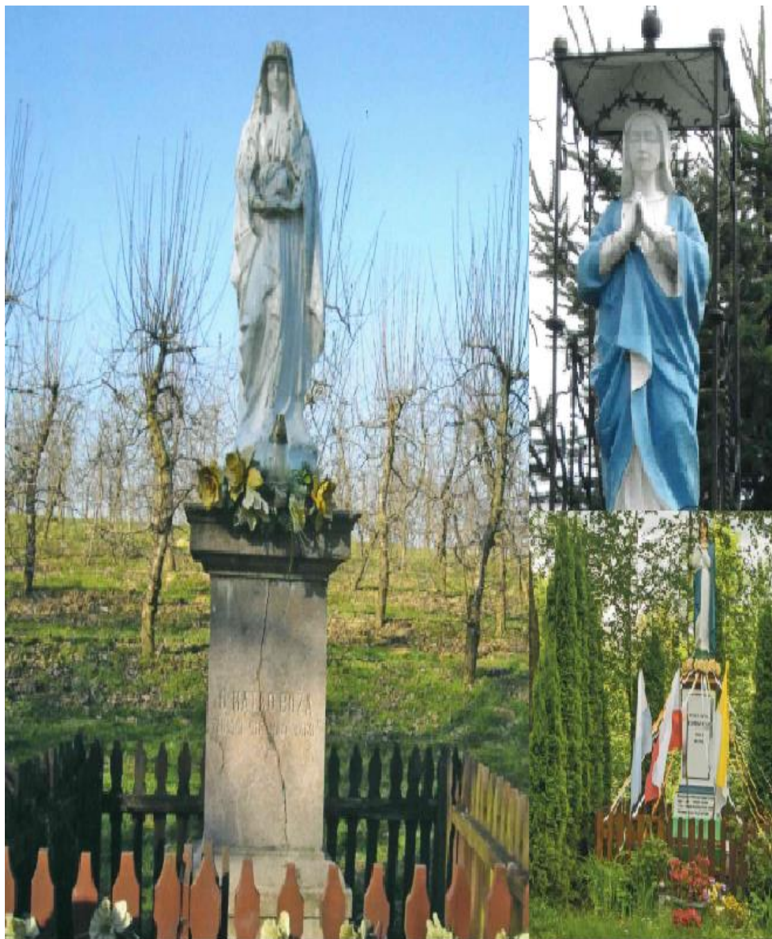
Zdjęcie 21. Figura Matki Boskiej w Piekarach (1932 r.), Figura Matki Boskiej Niepokalanej w Dębianach (1906 r.), Figura Matki Boskiej w Komornej (1927 r.)

Podobne zabytki w postaci kapliczek, krzyży i figur znajdują się w każdym sołectwie. Wśród najczęściej spotykanych zabytków kultu religijnego na terenie gminy Obrazów jest postać Matki Boskiej.