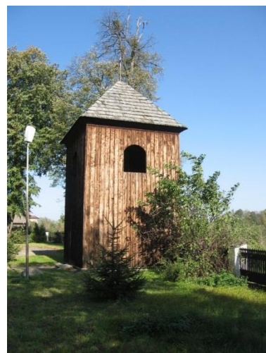
Zdjęcie 5. Dzwonnica przy kościele w Kleczanowie