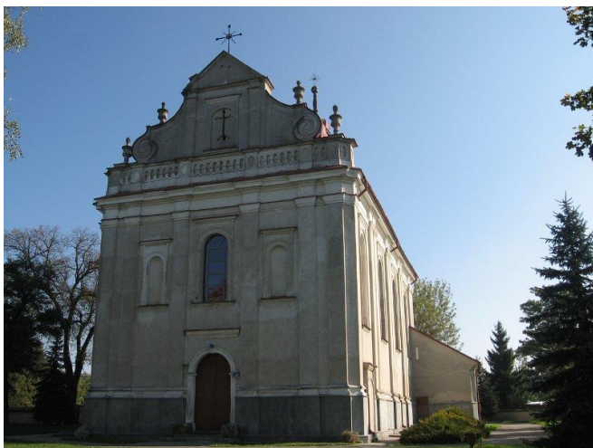
Zdjęcie 2. Kościół w Obrazowie