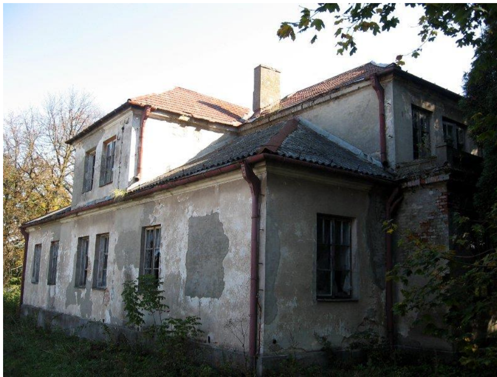
Zdjęcie 17. Dwór w Zdanowie

Jeden z czworaków popada w ruinę – nie jest w żaden sposób użytkowany i niszczeje. Drugi jest zamieszkały i jako taki jest odpowiednio zabezpieczony. Spichlerz natomiast, jako obiekt nie posiadający wartości zabytkowej, został kilka lat temu zburzony.