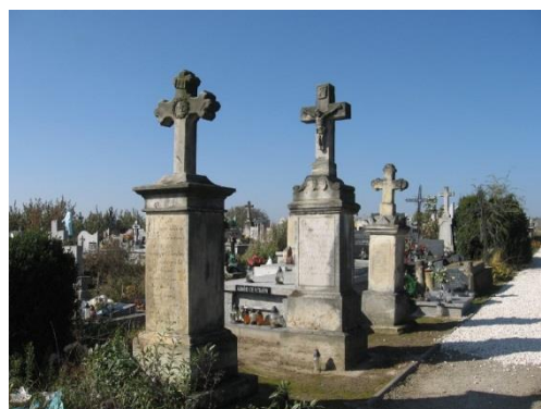
Zdjęcie 8. Cmentarz w Kleczanowie