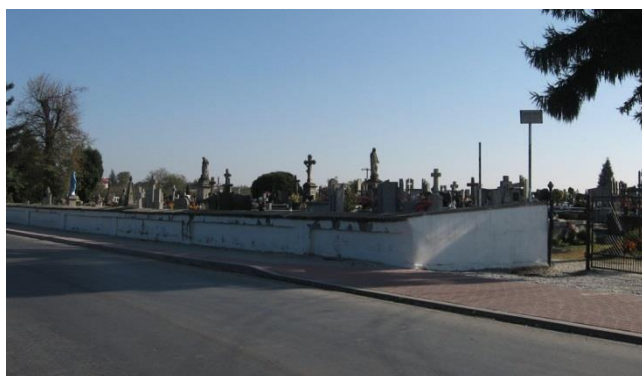
Zdjęcie 7. Cmentarz w Obrazowie

Dziedzictwo kulturowe Gminy Obrazów stanowią również cmentarze, głównie wyznaniowe. Wśród nich 3 zostały wpisane do rejestru zabytków: cmentarze parafialne w Kleczanowie oraz w Obrazowie – zlokalizowane są na nich mogiły o wartości historycznej, w tym ludności cywilnej z okresu II wojny światowej oraz cmentarz wojenny z czasów I wojny światowej na peryferii wsi Rożki. Opiekę nad nekropoliami przykościelnymi sprawują parafie. Ponieważ są one otwarte dla celów grzebalnych o poszczególne mogiły dbają także rodziny zmarłych. Obowiązek utrzymania cmentarza wojennego w Rożkach spoczywa na Gminie. Jest on zadbany, ogrodzony i odpowiednio oznaczony.