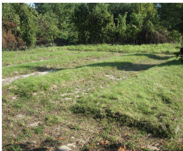
Zdjęcie 9. Cmentarz w Rożkach