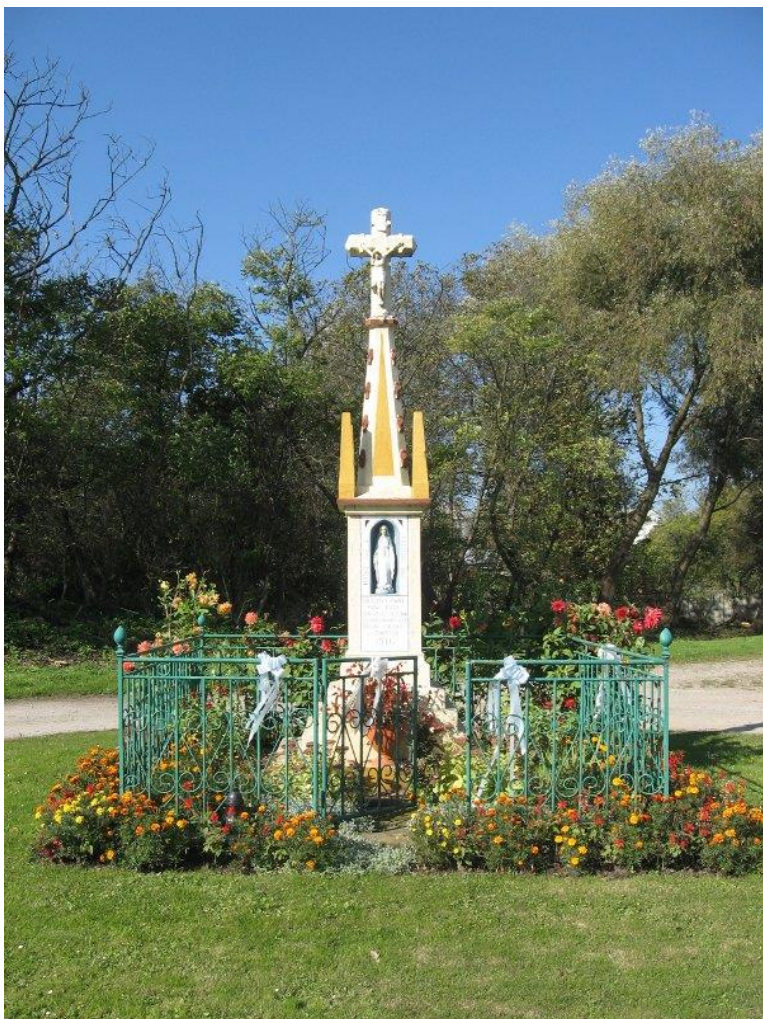
Zdjęcie 13. Figura w Rożkach

3. Dawny dwór w Świąticy stanowi współwłasność prywatną i gminną. Bardzo zaniedbany zamieszkiwany jest przez kilka rodzin. Otoczenie budynku to resztki dawnego parku (w 1957 roku wpisany do rejestru zabytków), który z biegiem lat, wraz z rozbudową mieszczącego się na terenie majątku zakładem usług technicznych systematycznie wycinano. Dziś zachowały się jedynie pojedyncze drzewa. Zabytkiem jest także spichlerz, do którego dojść można mijając zaniedbane budynki dawnych zakładów. Posiada front w formie portyku – widnieje na nim data 1873. Z każdej strony otoczony jest bujnymi zaroślami. Obecnie nie jest użytkowany i popada w ruinę.