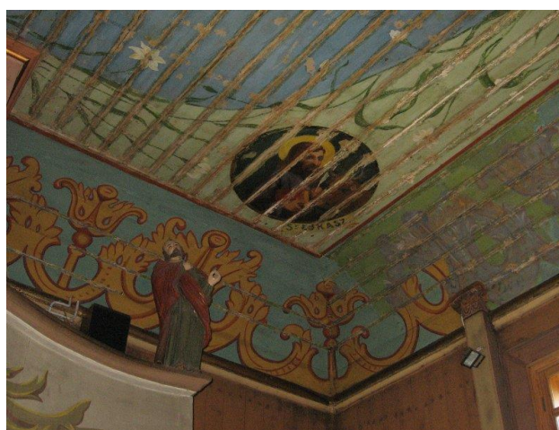
Zdjęcie 6. Wnętrze kościoła w Kleczanowie

Kościół, z racji ciągłego użytkowania i środków wystarczających na pokrycie bieżących wydatków, utrzymane są w dobrym stanie. Dzięki ofiarności parafian oraz dotacji przekazanej przez Urząd Marszałkowski Województwa Świętokrzyskiego odtworzono pierwotne malowidła we wnętrzu kościółka w Kleczanowie. Podobne prace, jednak tylko dzięki środkom zgromadzonym przez parafię trwają w kościele w Obrazowie. Zabytkowe zespoły kościelne, ponieważ wciąż spełniają swoje funkcje centrów życia religijnego miejscowej społeczności mają szansę przetrwać jeszcze długie lata w dobrym stanie. Dzięki pracom konserwatorskim zabytkowe kościoły zachowują swój oryginalny wygląd, a jako element krajobrazu kulturowego spełniają swą funkcję kształtowania indywidualnej i zbiorowej sfery pamięci.