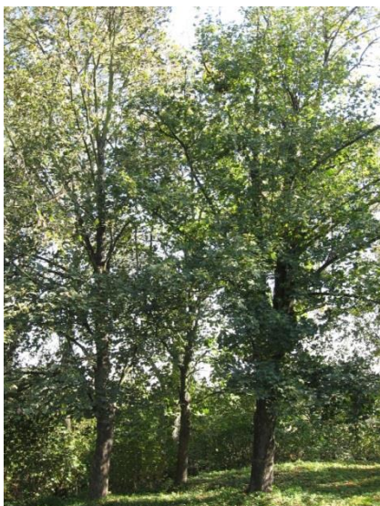
Zdjęcie 14. Park w Świąticy