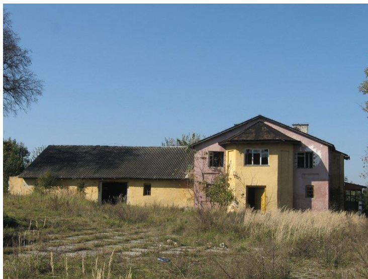
Zdjęcie 15. Spichlerz w Świąticy