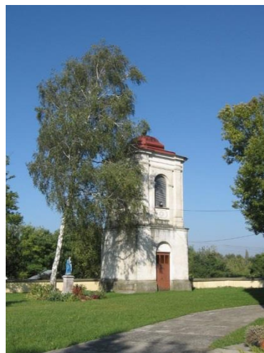
Zdjęcie 3. Dzwonnica przy kościele w Obrazowie

2. Drewniany kościół parafialny p. w. św. Katarzyny Dziewicy Męczennicy i św. Stanisława Biskupa Męczennika w Kleczanowie, wzniesiony pod koniec XVII wieku w miejscu dwóch poprzednich zniszczonych świątyń. Mieści m. in. zabytkowe ołtarze, ambonę, chrzcielnicę. Posiada dokumenty parafialne od 1773 roku. Uszkodzony i obrabowany w czasie II wojny światowej został odremontowany w latach 80-tych ubiegłego wieku. Większość wyposażenia kościoła pochodzi z XVIII wieku, m. in. rokokowy ołtarz główny z 1782 roku z obrazem św. Stanisława, rzeźbami św. Floriana i Rocha po bokach oraz rzeźbą św. Katarzyny na szczycie. Ołtarze boczne w nawie to dzieło XIX-wieczne. Do rejestru zabytków wpisana została także drewniana dzwonnica. Poza murami otaczającymi kościół znajduje się była plebania. Pochodzi on z początków XX wieku. Obecnie jest nieużytkowana i zaniedbana.