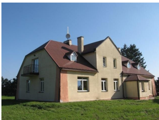
Zdjęcie 11. Dwór w Głazowie