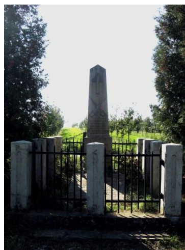
Zdjęcie 10. Cmentarz w Rożkach