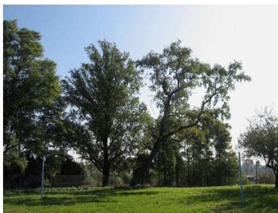
Zdjęcie 12. Park w Głazowie

2. Zabudowania dworskie w Rożkach obecnie są własnością prywatną. Dwór został całkowicie przebudowany w 2006 roku. Z dwóch czworaków, widniejących w rejestrze zabytków, jeden popadł w ruinę i stracił wartości zabytkowe. Podobnie stara studnia, również wykreślona z rejestru zabytków. Figura, znajdująca się przy wjeździe na teren byłego majątku dworskiego jest w dobrym stanie, odpowiednio wyeksponowana i przyciągająca wzrok. Wraz z cmentarzem wojennym w Rożkach to jedyne zabytki obecnie wpisane do rejestru wojewódzkiego konserwatora zabytków w tej wsi.