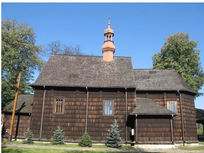
Zdjęcie 4. Kościół w Kleczanowie